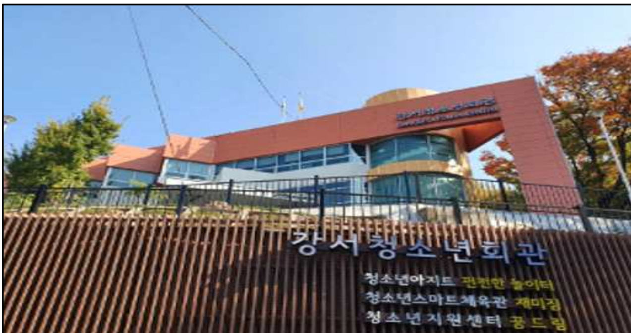
외부 정면 사진